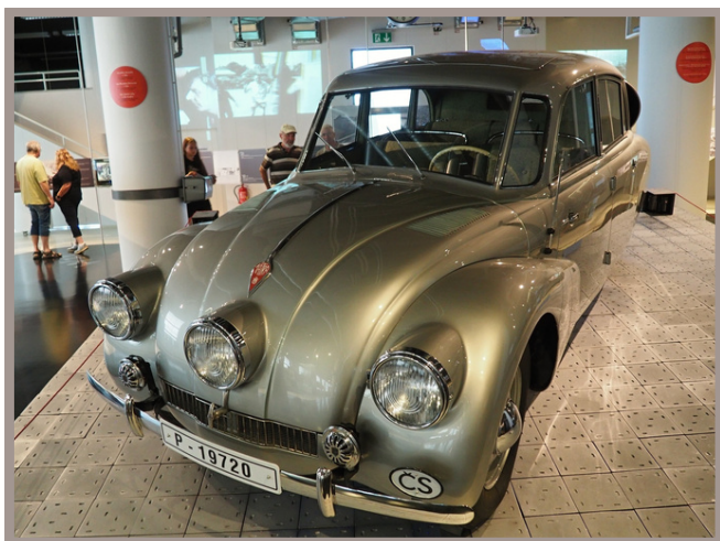
replika Tatry 87, se kterou HaZ objeli svět

autorka textu i fotografií: Jarmila Jandlová