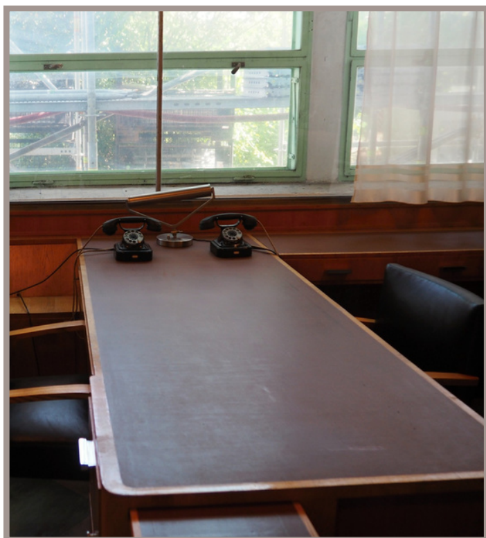
Baťova kancelář ve výtahu