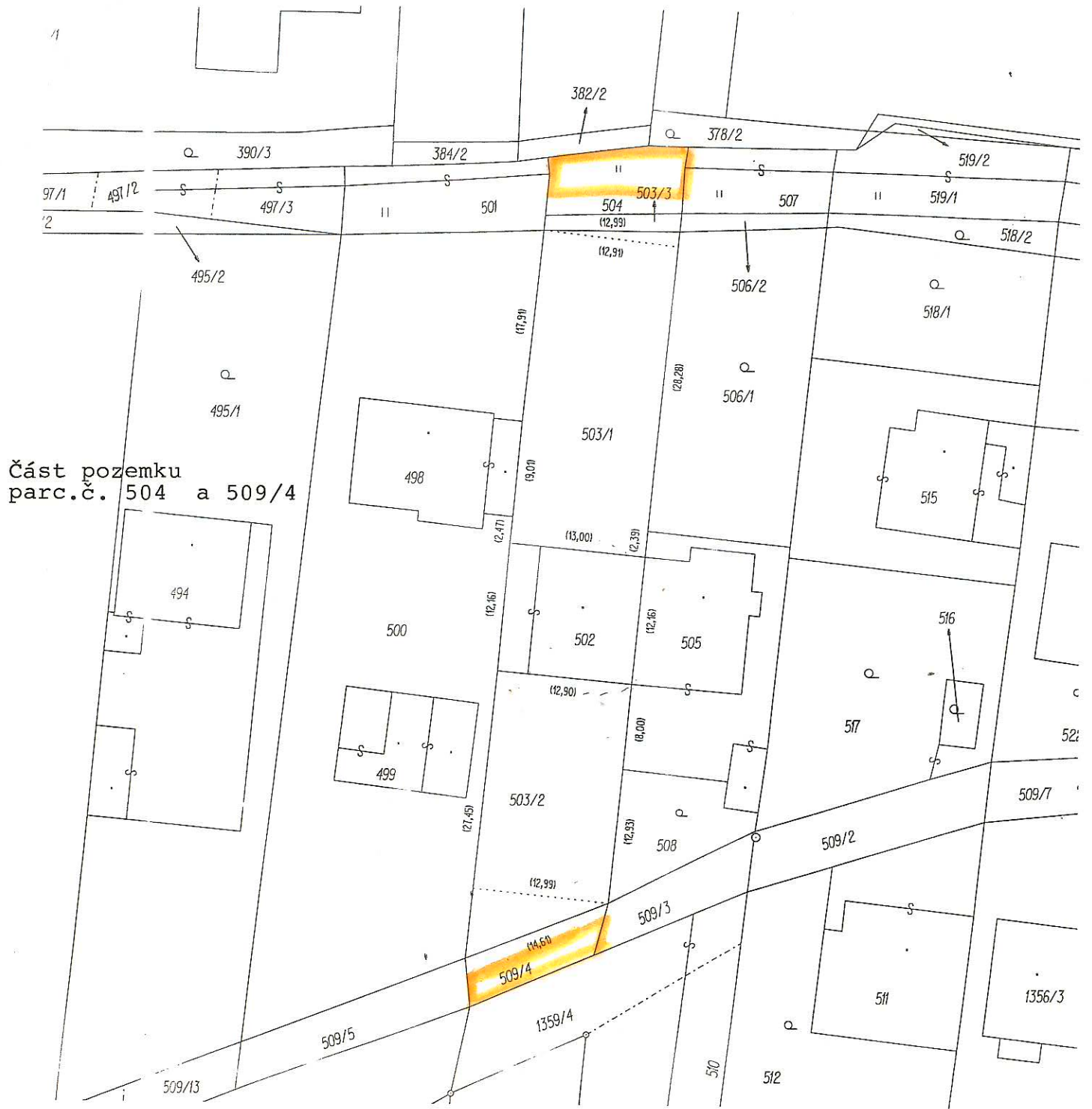
Část pozemku parc.č. 504 a 509/4